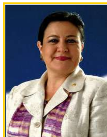
Embajadora Margarita Escobar Viceministra de Relaciones Exteriores para los Salvadoreños en el Exterior